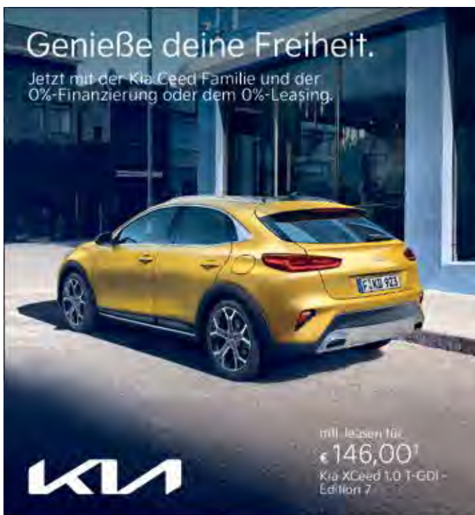
Abbildung zeigt kostenpflichtige Sonderausstattung.

Freiheit spürst du am besten, wenn du dich bewegst - wie zum Beispiel in den Kia Ceed Modellen. Erkunde neue Ziele und lass dich von ihren smarten Konnektivitätslösungen inspirieren. Begib dich auf Entdeckungstour mit deinem Kia XCeed Wunschmodell und profitiere jetzt von attraktiven 0% bei Finanzierung oder Leasing.